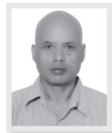
◆ शिशिल चित्रकार*

सूचना देश, समाज विकासको मूल आधार हुनेमा दुईमत छैन । तर आज देशको अवस्थालाई विवेचना गर्दा सूचना प्रणालीको कमजोरी, सूचनाको मूल आधार अभिलेख प्रणालीको कमजोर व्यवस्थापन र अझ सही र सक्षम कर्मचारीको अभाव भएको कटुसत्यलाई पनि नकार्न सकिदैन । दैनिक जीवनमा चाहिने सूचना, विभिन्न संघसंस्थाले दिने सेवाको सूचना, सडक यातायातलगायत कुनै पनि क्षेत्रमा चाहिने सूचना, कुनै पनि नयाँ परिवर्तनबारेको अग्रिम जानकारी दिन पनि सूचना अपरिहार्य आवश्यकता हुन्छ ।